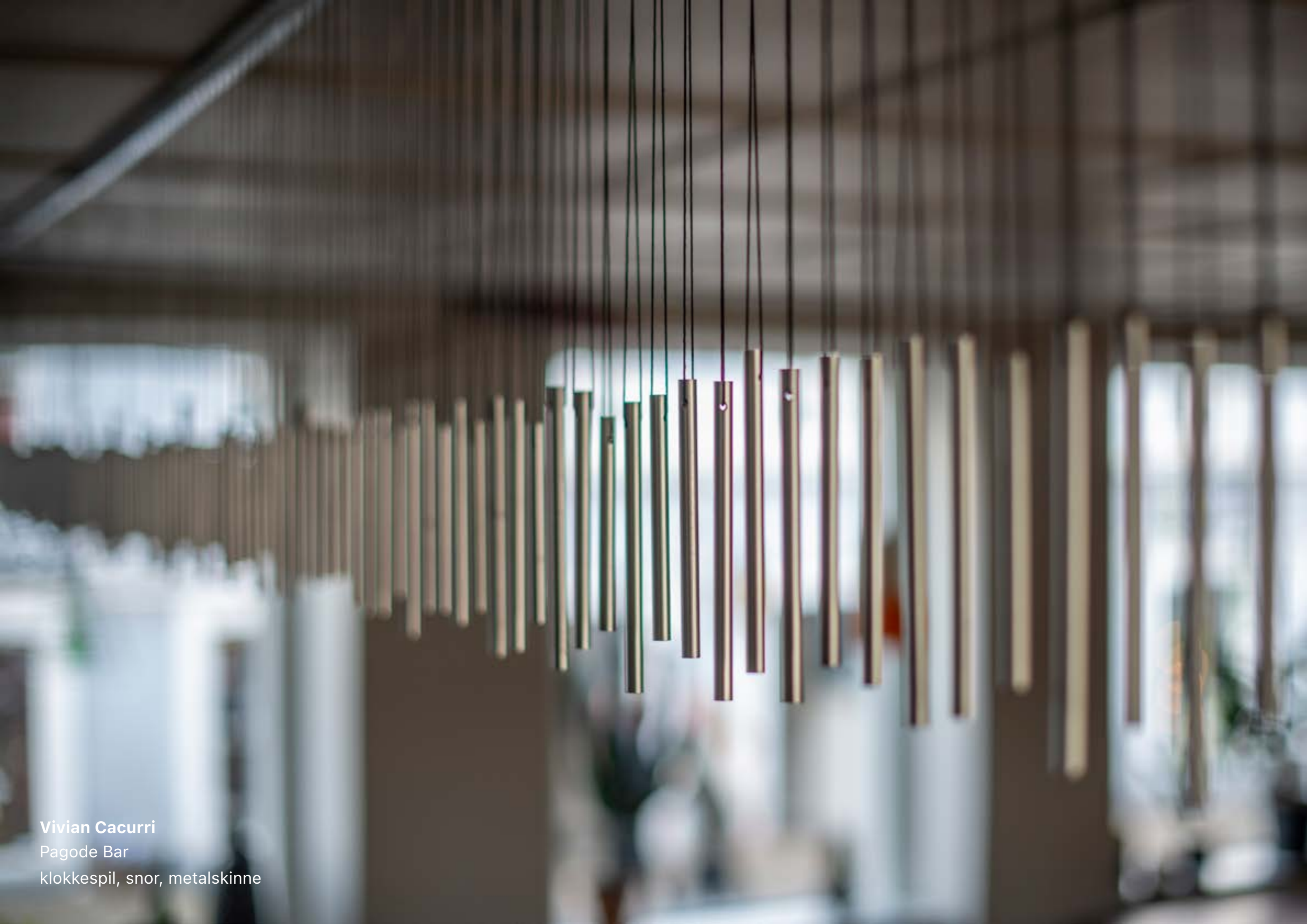
Vivian Cacurri Pagode Bar klokkespil, snor, metalskinne