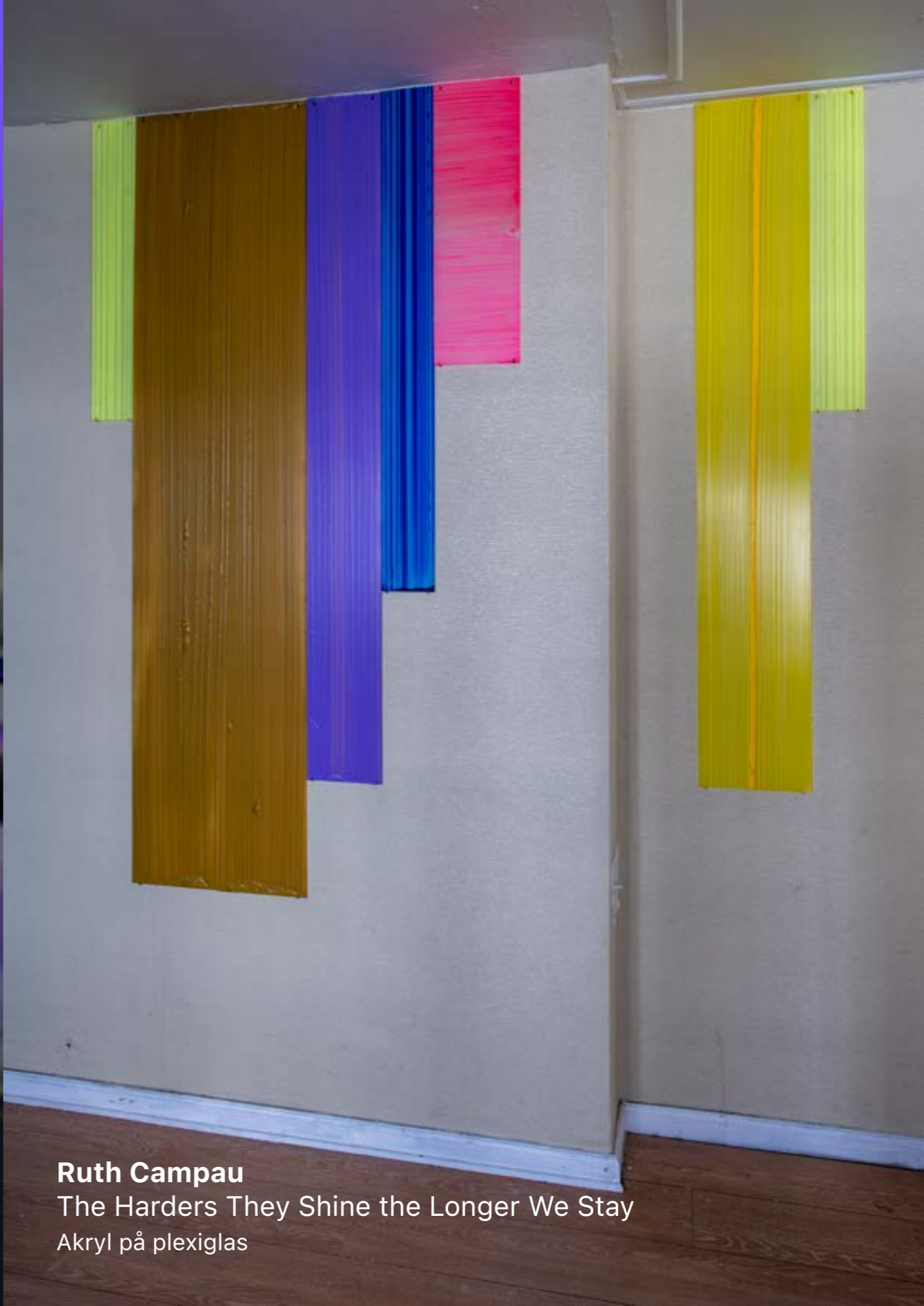
Ruth Campau The Harders They Shine the Longer We Stay Akryl på plexiglas